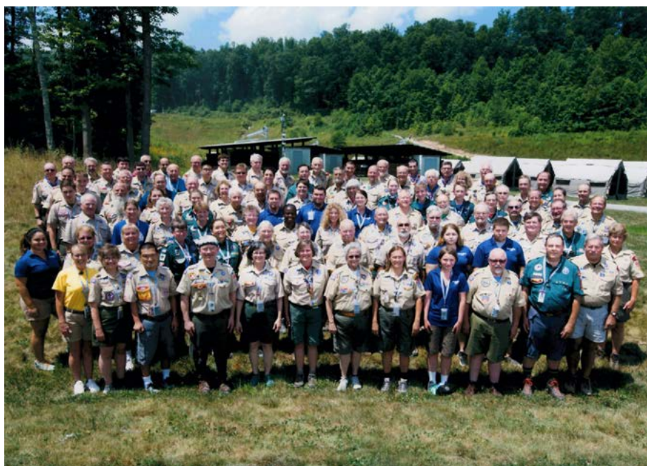
Equip de voluntaris al Jamboree dels Boys Scouts of America.

És necessari conèixer els diferents programes que ofereix la BSA als joves scouts, per a conèixer millor a aquesta associació.